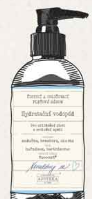
Hydratační vodopád (str. 10)

PRODUKT: Dopřejte si očistný rituál od negativní energie a především všech nečistot, které se na vaši pleti usazují, v podobě čistícího a odličovacího séra Hydratační vodopád.