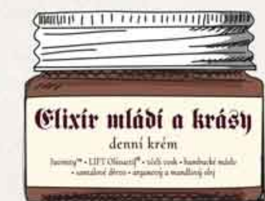
Elixír mládí a krásy denní krém (str. 3)

PRODUKT: Dopřejte si teď jen to nejlepší z nejlepšího a udělejte si radost exkluzivním denním výživným krémem Elixírem mládí a krásy.